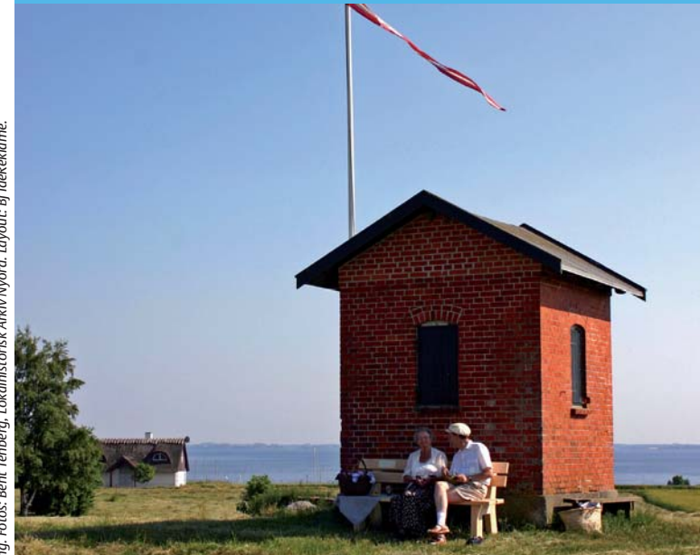
Lødgiver: Vordingborg Udviklingselskab i samarbejde med Nyord Lokalhistorisk Forening. Layout: BJ IdréReklame.